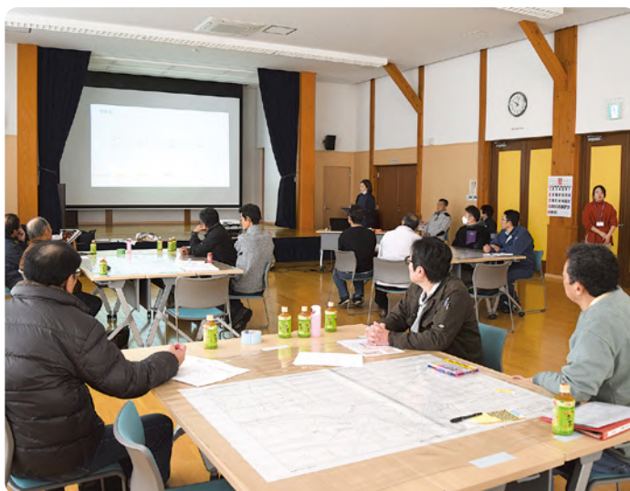
▲ マップづくり前の学集会(造語)の様子