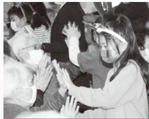
亀岡小学校（高齢者施設訪問）