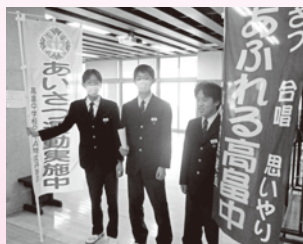
高島中学校（あいさつ運動）