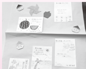
高島高校（高齢者への絵手紙活動）