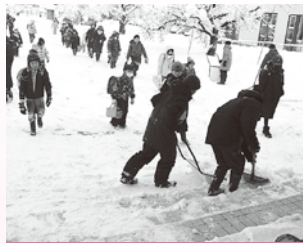
屋代小学校（除雪活動）