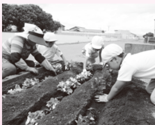
和田小学校（花いっぱい運動）