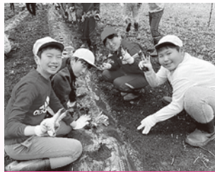
二井宿小学校（じゃがいも栽培）