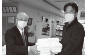
はとみね荘への贈呈