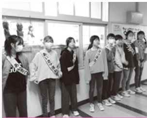
高島小学校（あいさつ運動）

身の回りの人々や地域との関わりのなかから、「ふだんの暮らし」のなかにどのような福祉的課題があるかを自ら学び、課題を解決する方法を考え、解決のために行動する力を養うことで、ともに生きる力を育むことを目的としています。町内の小・中学校、高校では、各校の特色を活かした福祉教育が展開されました。