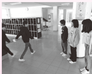
糠野目小学校（あいさつ運動）