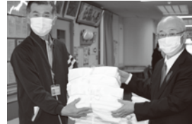
まほろば荘への贈呈