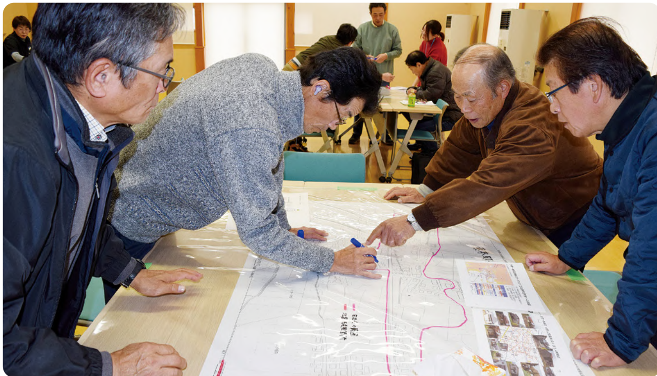
▲ 大字一本柳 4自治会合同での新規作成活動