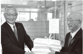
たかはた荘への贈呈

施設利用者の清潔を保つため毎日使われています。特養3施設合計で1日あたり1,000枚以上の清拭布が使われているため、毎年の贈呈には大変喜ばれています。